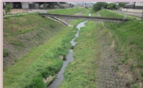
▶ きれいな小泉川に