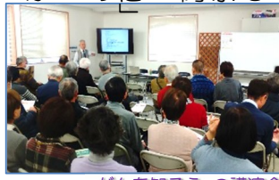
がんを知ろうの講演会

清田理事長は、がんの3大標準治療についてや京都の病院などのがんに関する知識を説明した後、「がんにならないためには禁煙の推進、食事上の配慮、ピロリ菌の除菌、人間ドックの受診などが必要と講演しました。また「がんになった」時には、がんに対する正しい知識をもって治療を受けるや、がん支援センターに相談する必要があると話しました。