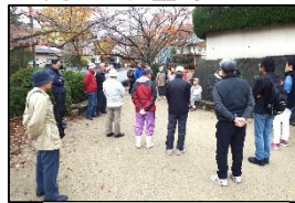
高台での避難訓練

10月28日(日)長岡第五小コミュニティ主催の「総合防災訓練」が、長五小であります。当日グラウンドでポンプ放水訓練、マンホールトイレ設置訓練があり、体育館で避難所開設訓練があります。最後に炊出し訓練で作った豚汁と非常食を試食します。特に今回は実際の避難を想定して「ペットの避難訓練」も実施します。