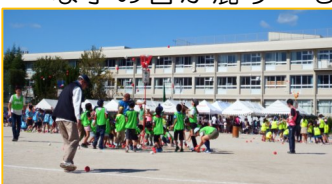
第56回市民大運動会

スポレク 第56回市民大運動会は、10月28日(日)に長五小校区「市民大運動会」が行われ、和風ステージも盛りだくさんです。また、長五小校区「市民大運動会」は、10月28日(日)に長五小校区「市民大運動会」が行われ、和風ステージも盛りだくさんです。