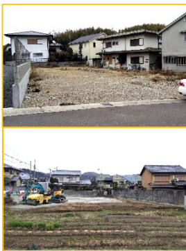
上:3軒の工事が始まる乙張地区 下:既に工事が始まっている地区の現状

●「環境」 金ヶ原乙張地区で3軒の宅地造成建築計画があります。場所は奥海印寺納所線(府道204号線)沿いの湯川酒店の通りで、既に5軒の工事が始まっている場所の少し南です。業者による説明会を17日(日)10時からさくら会館で行います。