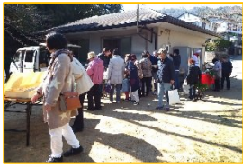
賑わった冬のとれとれ市

●3月9日3号公園で冬のとれ市を開催しました。100人近くの皆さんの参加があり、これとれ海産物や長岡銘菓・新鮮野菜などを買い求めました。抽選会もありました。