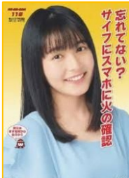
忘れなさい? サイフにスマホに火の確認

●平成31年春季火災予防運動が行われました。その標語は全国「忘れなさい? サイフにスマホに 火の確認」乙訓「乙訓の」