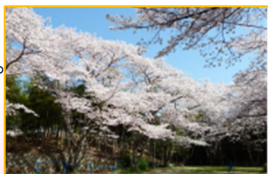
昨年3月31日の3号公園の桜

今年のさくら祭りは、3月31日(日)11時から、3号公園であります。詳細は後日お配りするチラシでお知らせします。昨年は、4月に入ってからの実施でしたが、今年は温暖化に考慮して早く実施します。酒類をチャーム付で準備し、昼食も実費で用意し、「桜の森の満開の下」で親睦を深めたいと思います。多数お集まりください。同時開催で「古本市」を行います。ご家庭で不要な書籍があればお持ちいただき、当日ご興味のある本をお持ち帰りください。