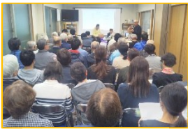
昨年の総会の様子

●「常任委員」 常任委員は現在立候補が1名、退任の希望者が1名あります。引き続き募集しています。地域のために力をお貸しただければと思います。とくに最近勤め先を卒業された方は、是非応募いただければと思います。