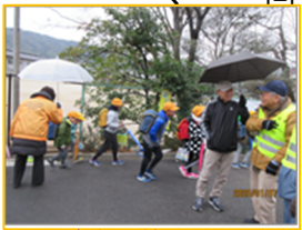
児童と一緒に5小へ

1月17日(日)「第3回子ども交通安全啓発推進日」で、高台でも6名が参加して交通安全に注意しながら児童を5小まで送り届けました。登下校の児童には皆さんも注意いただき、ひと声かけていただければと思います。