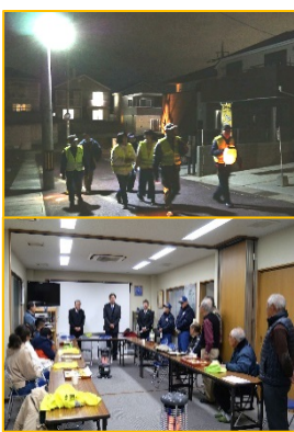
防火訓練の様子 上：高台自主防災会 下：市消防局の指導も受けました

自治会には住民の親睦だけでなく、これらに多くの風水害や地震などの災害時に命を守る組織としても不可欠です。昨年再編成した高台自主防災会が一体となって、万に備えたいと思っております。