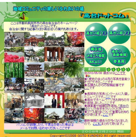
「高台ドットコム」のトップページ

いない方は、是非一度ご覧いただければと思います。また月に何回かは更新していますので、時々開いてみていただければと思います。 http://www.taka-dai.com/ です。検索で「高台ドットコム」と入れてもトップに出きます。