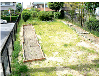
花壇を作った5号公園

今年公園除草作業は6月6日(日)午前10時から行います。担当いただく公園は下表のとおりです。皆さんの積極的な参加をお待ちしています。